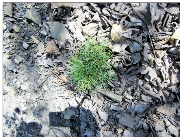
Рис. 3. Гнездовое возобновление кедра на отвале с инициальным эмбриоземом.

Особое место в зарастании отвалов имеет облепиха крушиновидная, которая относится к олиготрофным и симбиотическим растениям (Баранник, 1988). Облепиху использовали на отвалах в качестве первичного фитомелиоранта с середины 70-х гг., когда она была впервые высажена на отвалах Байдаевского угольного разреза (рис. 4).