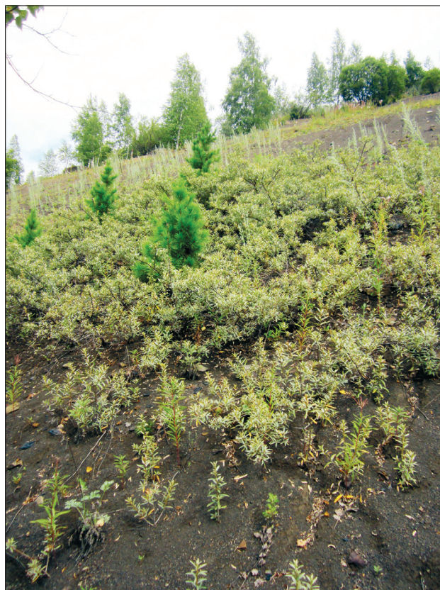
Рис. 4. Заросли облепихи на склоне отвала с единичным подростом сосны.

В семеномерах не обнаружены плоды клена ясенелистного (длина крылатки более 1 см, поэтому семена клена не попадают в семеномер), тем не менее возобновление клена в северной части Кузнецкой котловины значительное и достигает 6.35 тыс. шт./га в умеренно благоприятных условиях. Меньше всходов клена обнаружено в других вариантах. Большинство растений на отвале погибает в течение 2–3 лет, и подрост