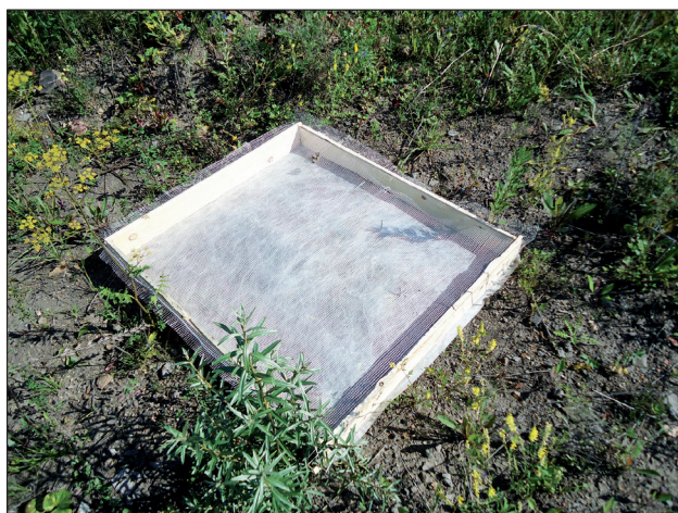
Рис. 2. Семеномер.